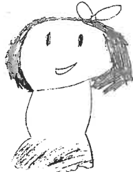
＜992 たがはしあかり＞ 5 310