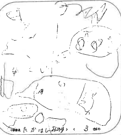
＜992 たがはしあかり＞ 3 310