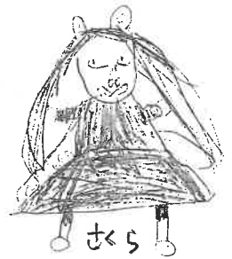
＜992 内田明海＞ 9 310

おしいれがこわい ものからたのしいはの にかわったのか おもしろかった。 SLがかこよらた